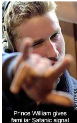
Princ William (jedan od poznatijih "navijača" Longhornsa)

Dok se za Bush-ovu familiju možda i može reći da su navijači Longhorns-a, da li se isto to može reći i za Klintona, italijanskog predsjednika Berluskonija, i ostalu elitu?