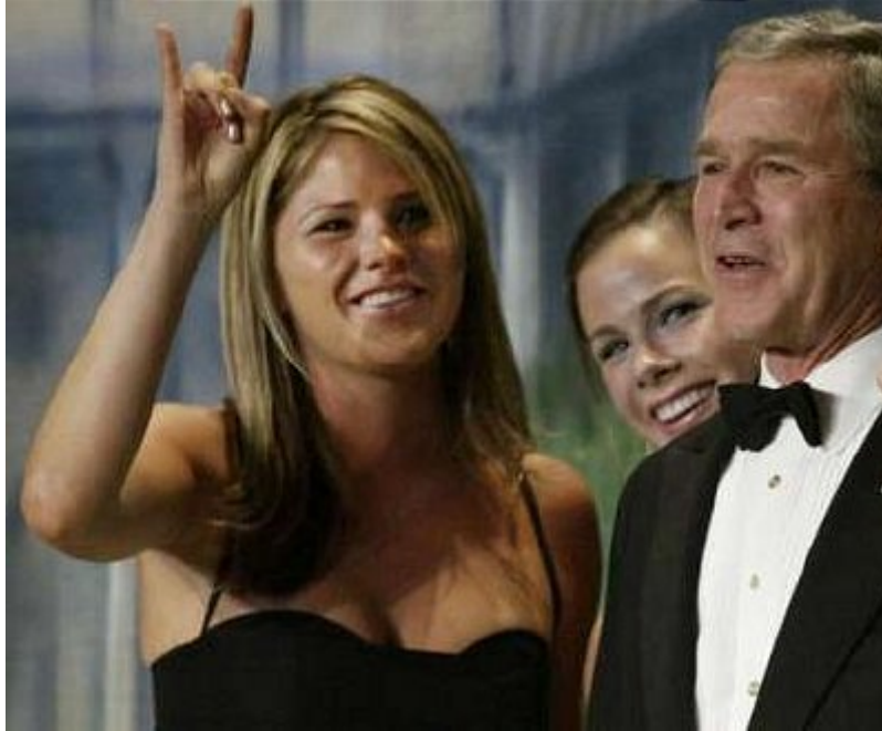
Iver ne pada daleko od klade: I Bush-ova kćerka upućuje signale

Pozdrav, "Hook 'em, 'horns!" – u slobodnom prevodu: "Nabićemo ih na rogove" (ili "nabijte ih na rogove") je, navodno, tradicionalni navijački slogan podrške timu Longhorns-a, sa Teksaškog Univerziteta, doznali smo iz medija.