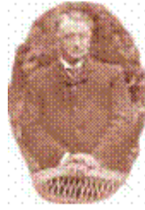
Cecil Rhodes, osnivač elitne organizacije “Okrugli stol”

(“...Tvrdim da smo mi, Englezi, suuperiorna rasa na svijetu i što više Planete naseljavamo, tim bolje po ljudsku rasu... Zašto mi ne bi osnovali tajnu organizaciju kojoj bi bio za cilj dovođenje cijelog neciviliziranog svijeta pod vladavinu Britanije i Sjedinjenih Država i time stvaranja jednog Anglo-Saksonskog imperija...” Cecil Rhodes, “Confession of Faith”, 1877.)