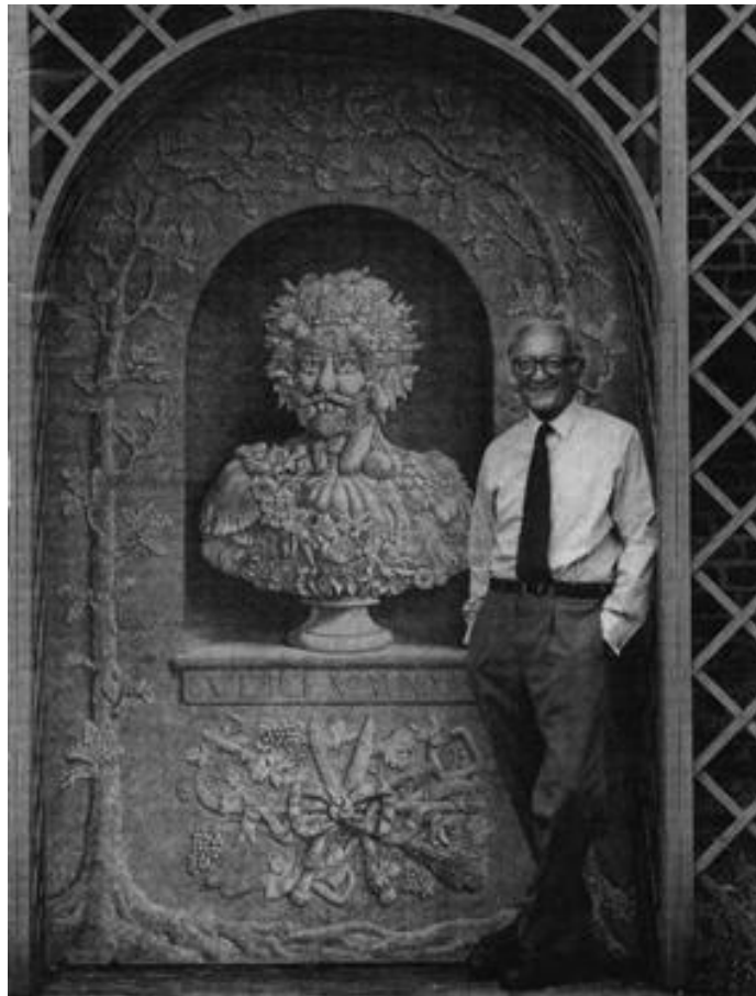
Lord Peter Carrington, lider Bilderberga 1990-1999, ispred ulaza u svoju baštu; u pozadini je pagansko božanstvo