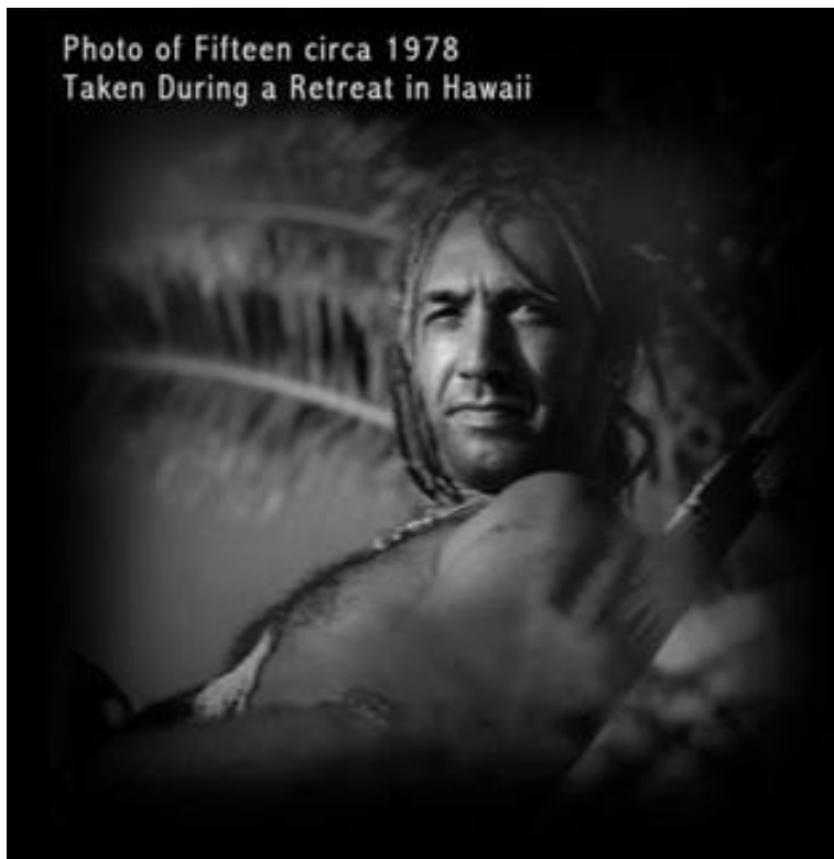
Jedina dostupna fotografija "Petnaest" iz konca 1970-ih godina

Plaće ovih izabраниh naučnika su u prosjeku po pola milliona dolara godišnje (dvostruko veće od plaće predsjednika SAD). I to bez odbijanja poreza, jer zvanično ovi ljudi ne postoje sa identitom pod kojim su rođeni. Velika većina živi u naselju nedaleko od laboratorija. Skromne trosobne kuće i polovna auta ne odaju male "bogataše". Zapravo, niko ne živi luksuzno niti se razbacuje novcem. Većina donira novac dobrotvornim organizacijama.