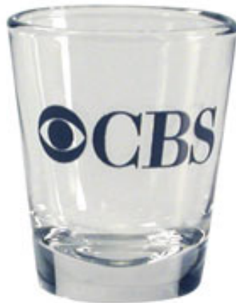
Logo američke TV stanice CBS sa svevidećim okom