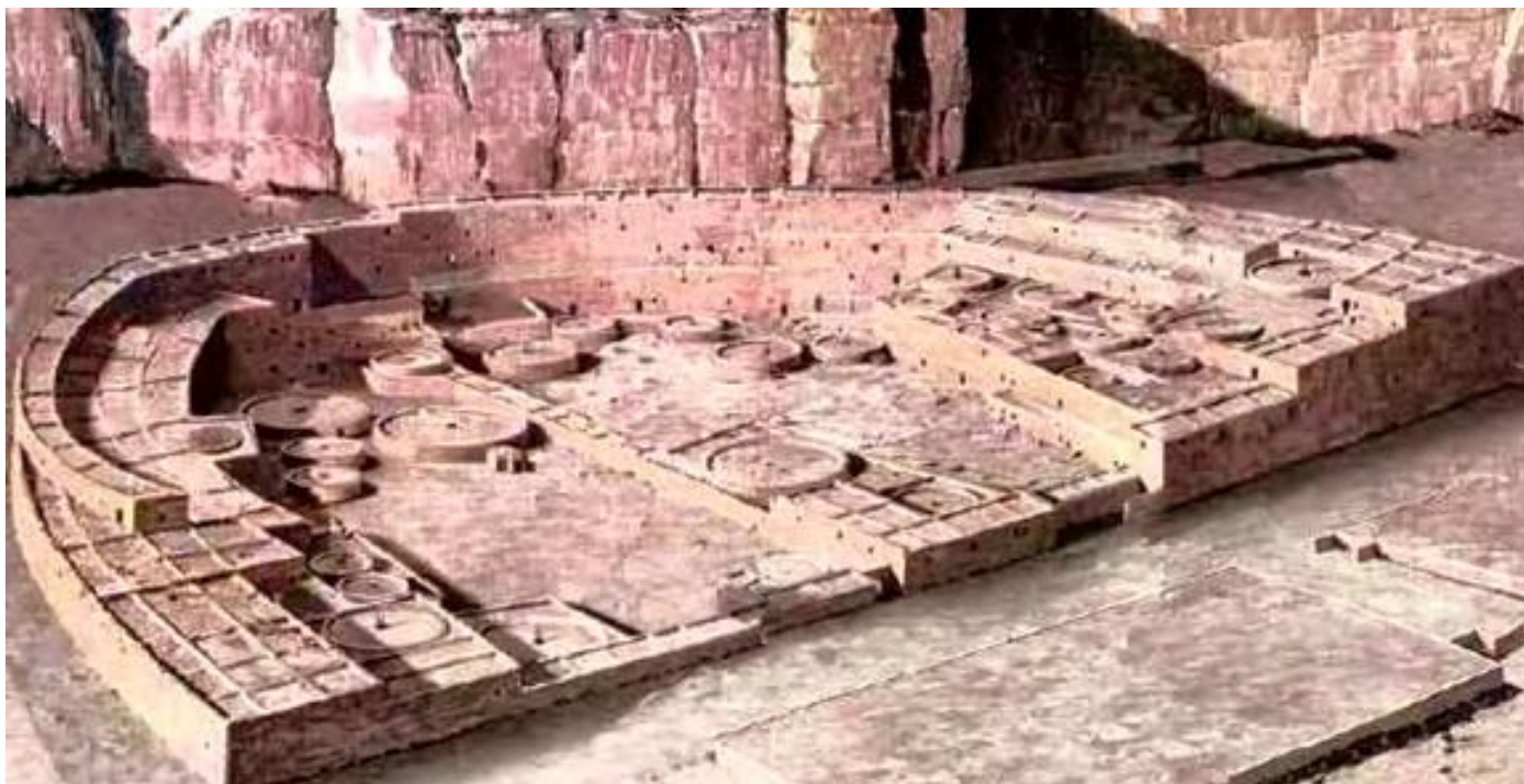
Originalni izgled Pueblo Bonita oko 1 100. godine, središta civilizacije Anasazija u Čako kanjonu (Novi Meksiko)