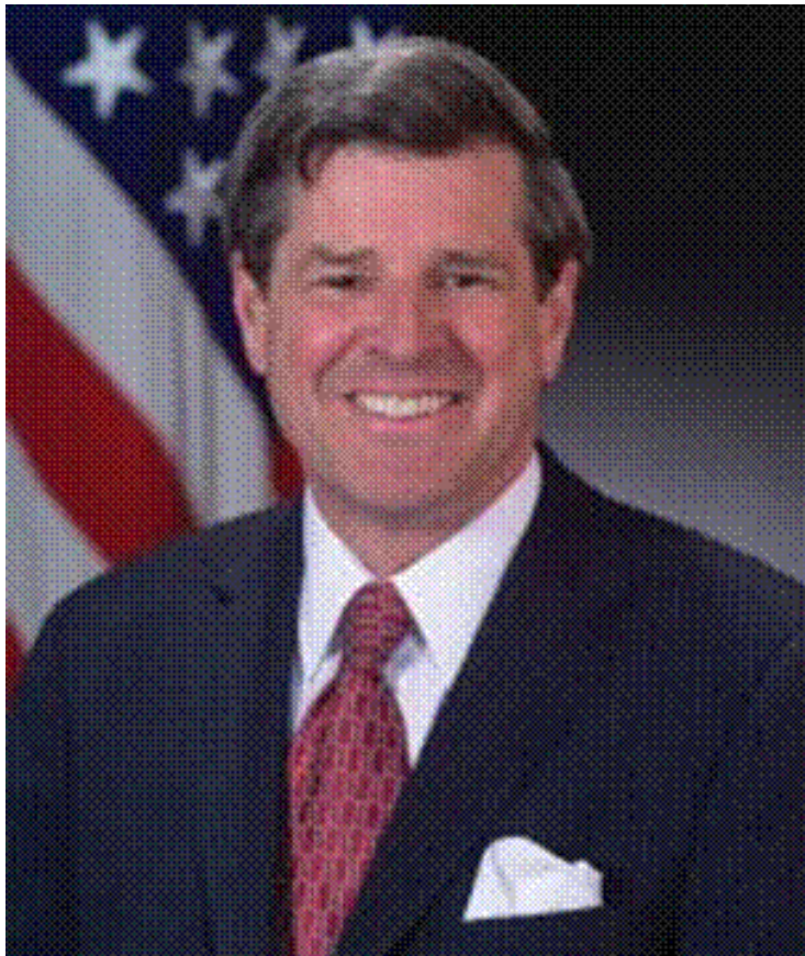
Ambasador L. Paul Bremer, diplomac sa Yale University, Kissingerov asistent 1972-1976, izvršni direktor (od 1989.) "Kissinger & Associates", bio je "upravnikom" Iraka u najosjetljivijem periodu okupacije Iraka (11.05.2003. – 28.06.2004.)