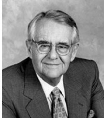
Peter Peterson, čelnik Odbora direktora američkog Savjeta za međunarodne odnose