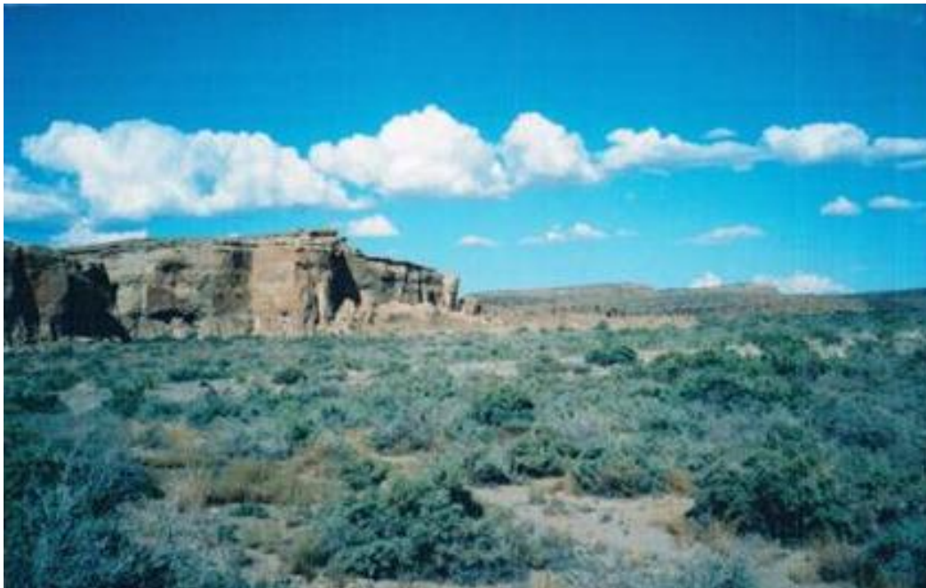
Kanjon u Novom Meksiku u kome se nalazi tajanstvena pećina