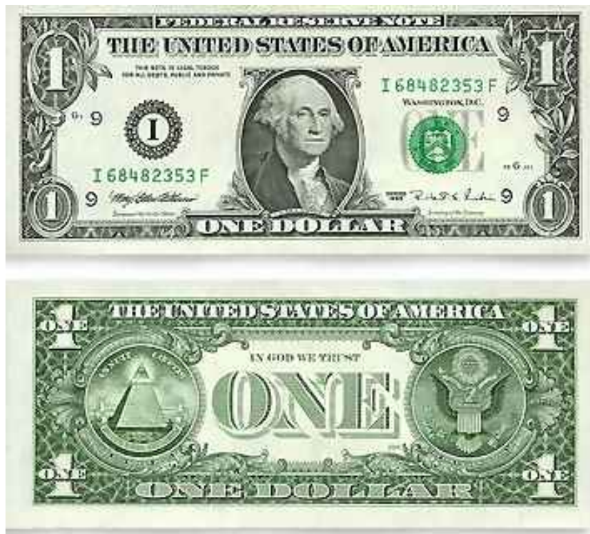
Američka novčanica od jednog dolara vrvi masonskim simbolima

Posmatramo li pod povećalom otkinuti vrh piramide sa okom, može se primjetiti da tekstura oka ne naliči ljudskom oku. Ko nas onda posmatra?