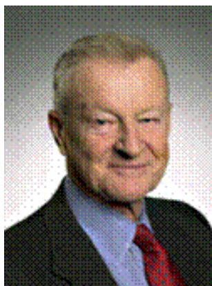
Zbigniew Brzezinski, lider NSA za vrijeme Carterovog predsjednikovanja (1977-1981),