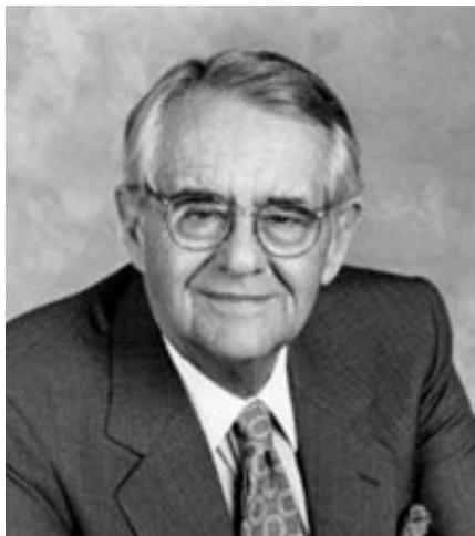
Peter Peterson, čelnik Odbora direktora američkog Savjeta za međunarodne odnose