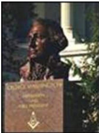
Bista jednog od najpoznatijih američkih masona, prvog predsjednika SAD Georga Washingtona, ispred prostorija masonske lože u Washingtonu

Američki Kongres nepodijeljeno podržava sintagmu o "Novom svjetskom poretku" i sa Republikanskog (pretežno uticaj francuskih masona) i sa Demokratskog (britanski masoni) kraja.